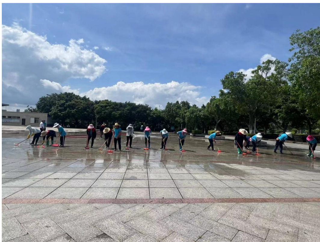
南校区安泰物业刷洗广场