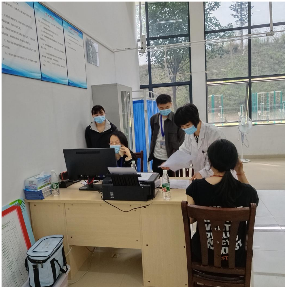
疾控中心进行疾病流调工作现场