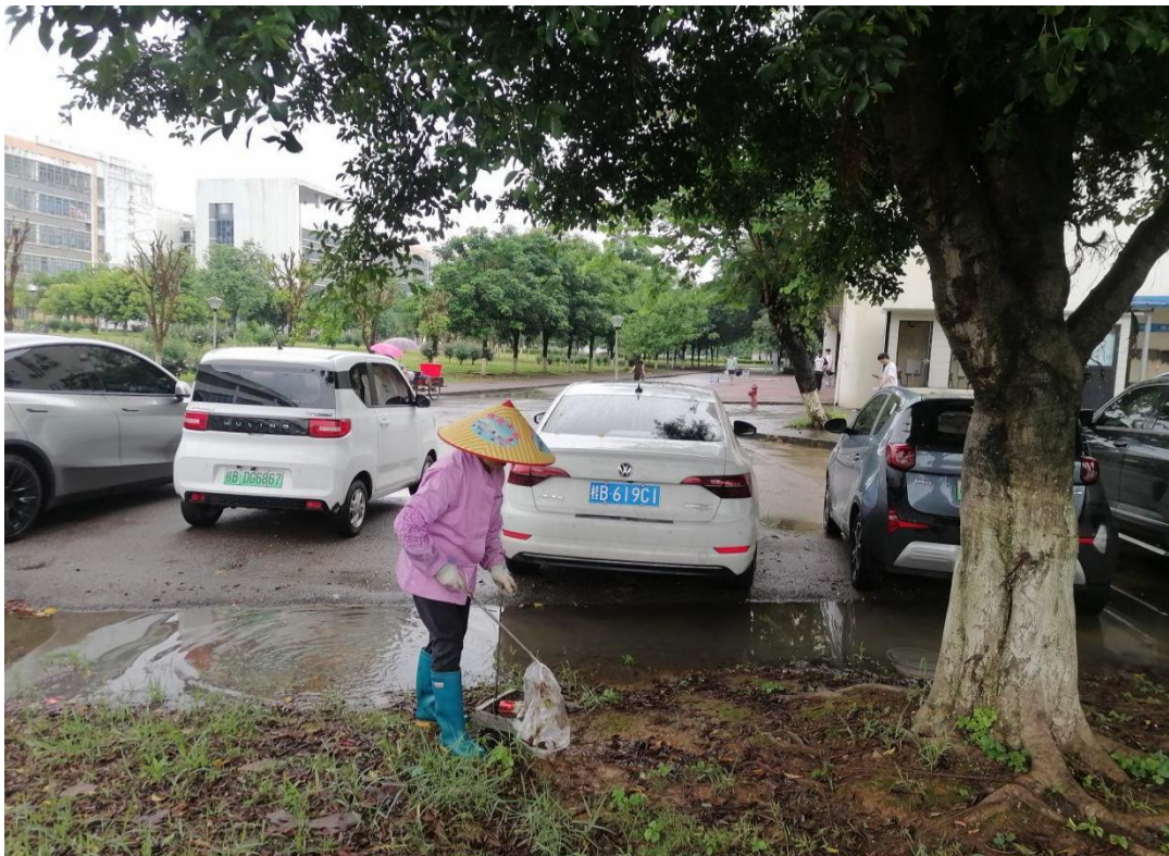
南校区朋宇组物业保洁员雨天清洁绿化带和道路上的垃圾