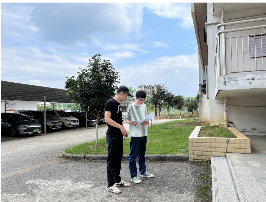
验收第一实训楼地砖修补