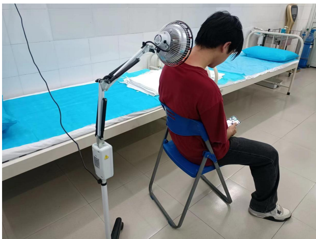
远红外线照射治疗