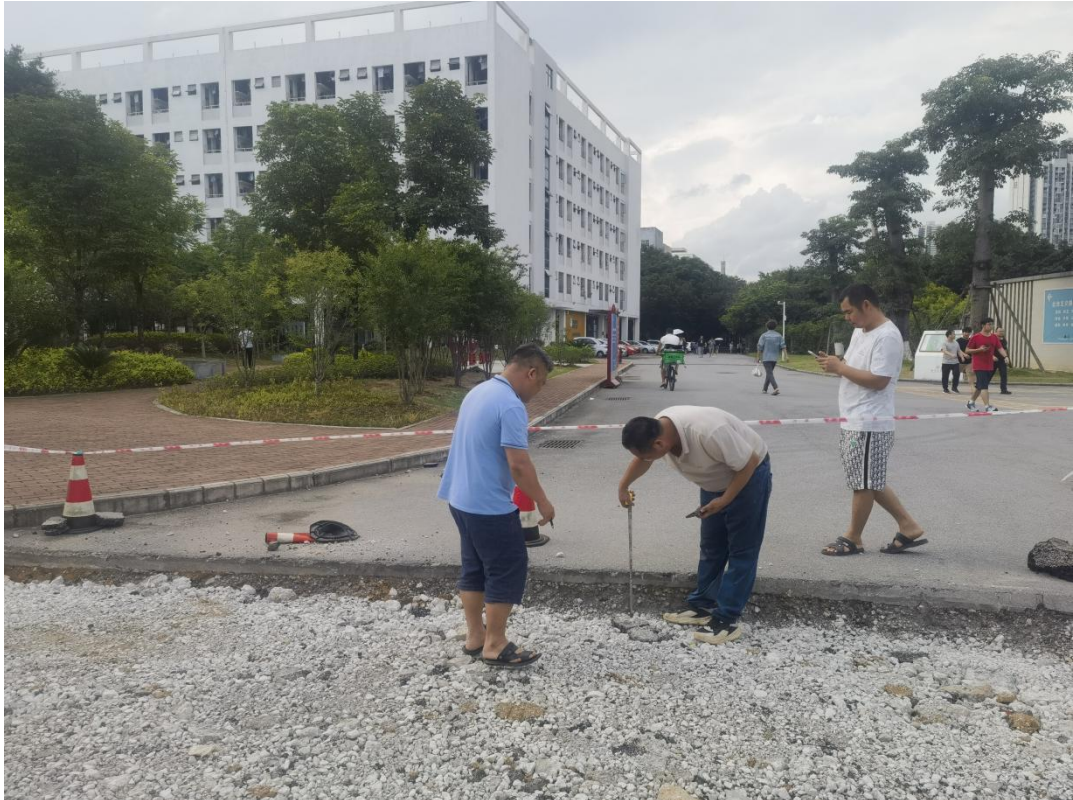
验收第一实训楼北面道路修复