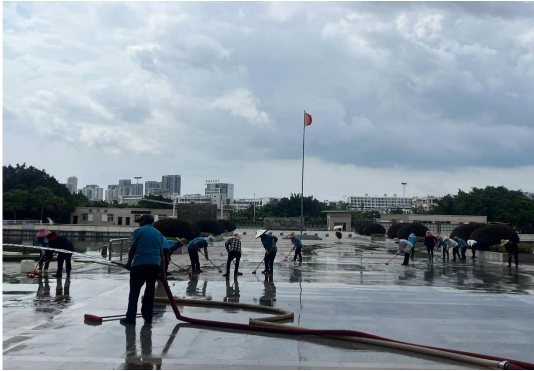
南校区安泰物业高压冲洗广场