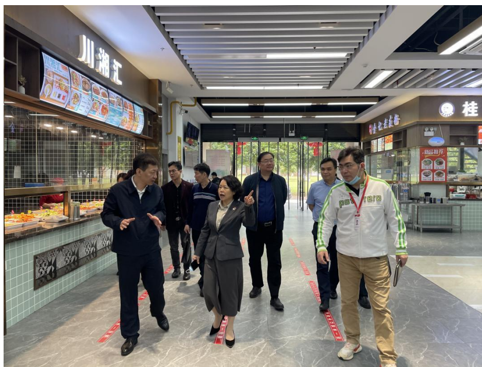
柳州市市委副书记杨斌到南校区二食堂进行检查