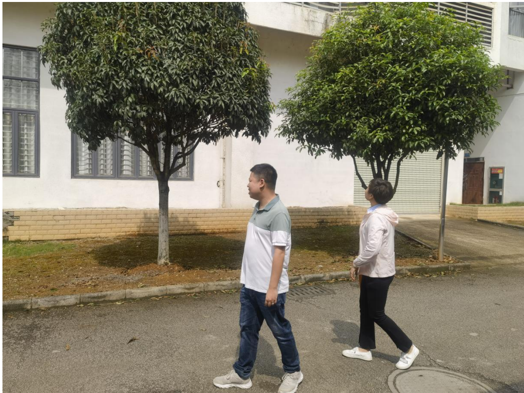
排查南北校区防洪设施情况