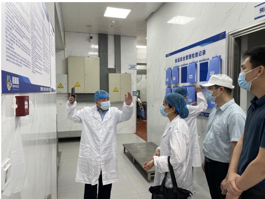
鹿寨县市场监督管理局执法人员到北校区食堂进行飞行检查