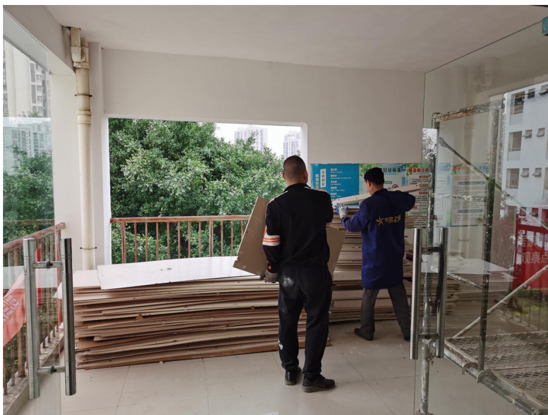
对第八栋公寓旧家具做报废处理