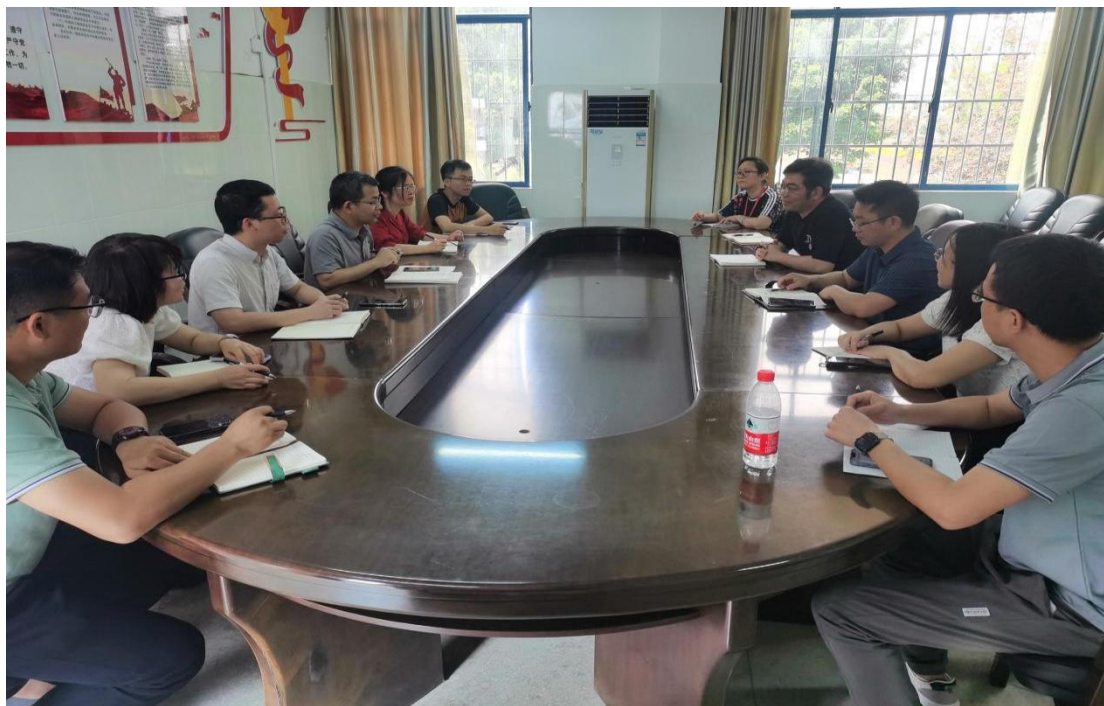
柳州城市职业学院调研交流学习现场

在部门官网发布《甘居人“后”担使命 “勤”于人先守初心——五一致敬后勤基建每一位劳动者》