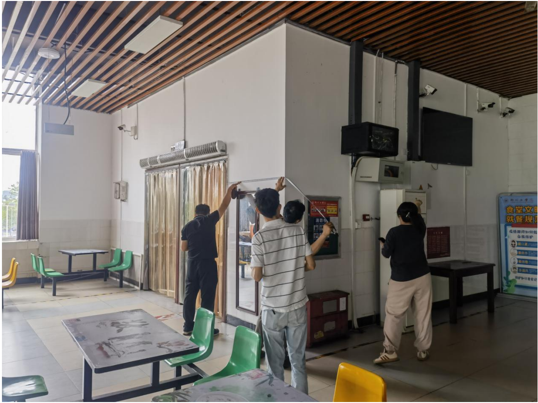
南校区一食堂安全隐患设备设施维修更换项目工程量现场复核