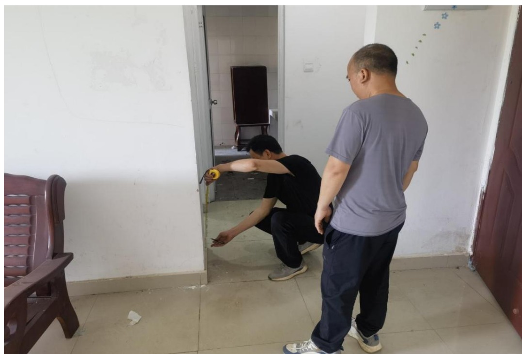
第八栋教师公寓翻新工程（宿舍）