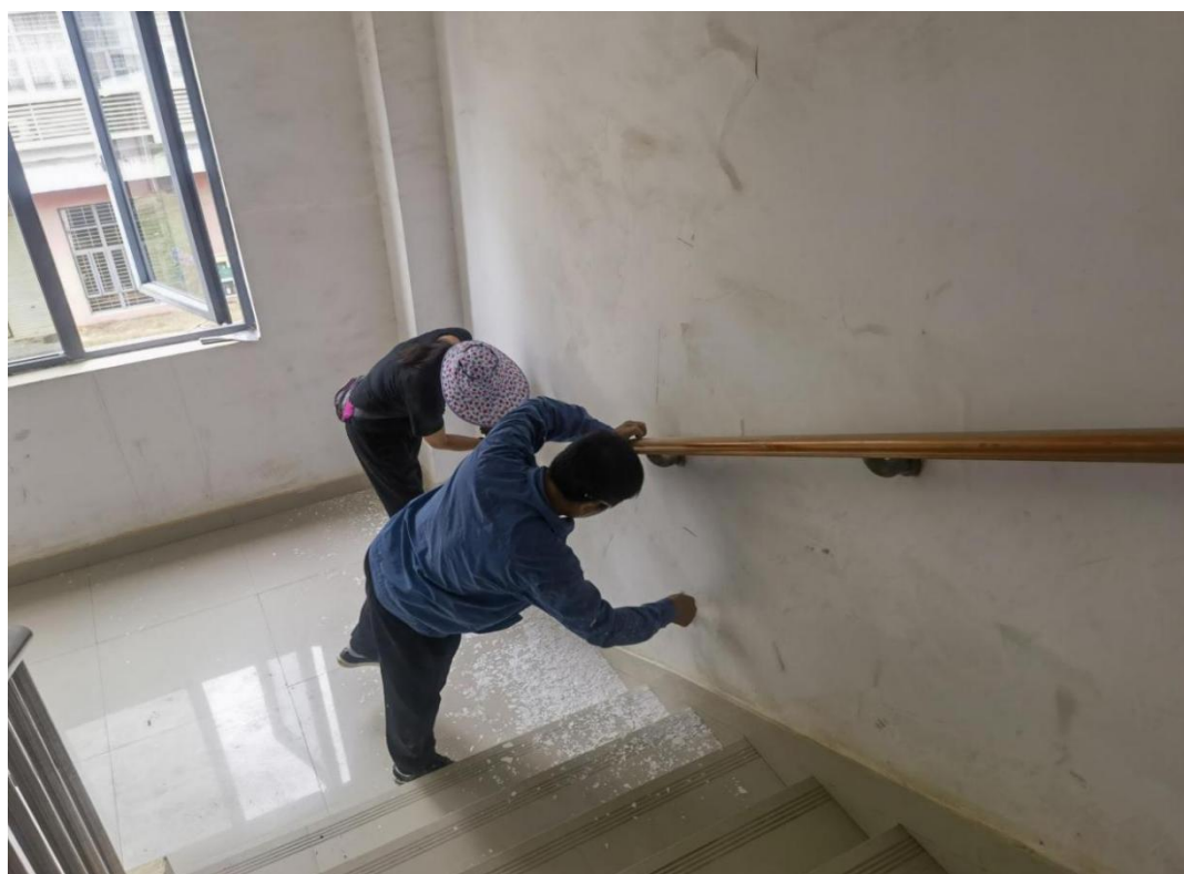
第八栋教师公寓翻新工程（楼道）