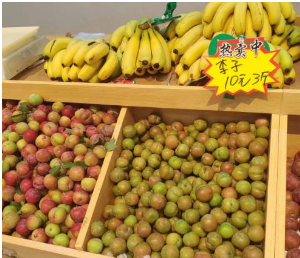
北校区水果店在店内举办优惠活动