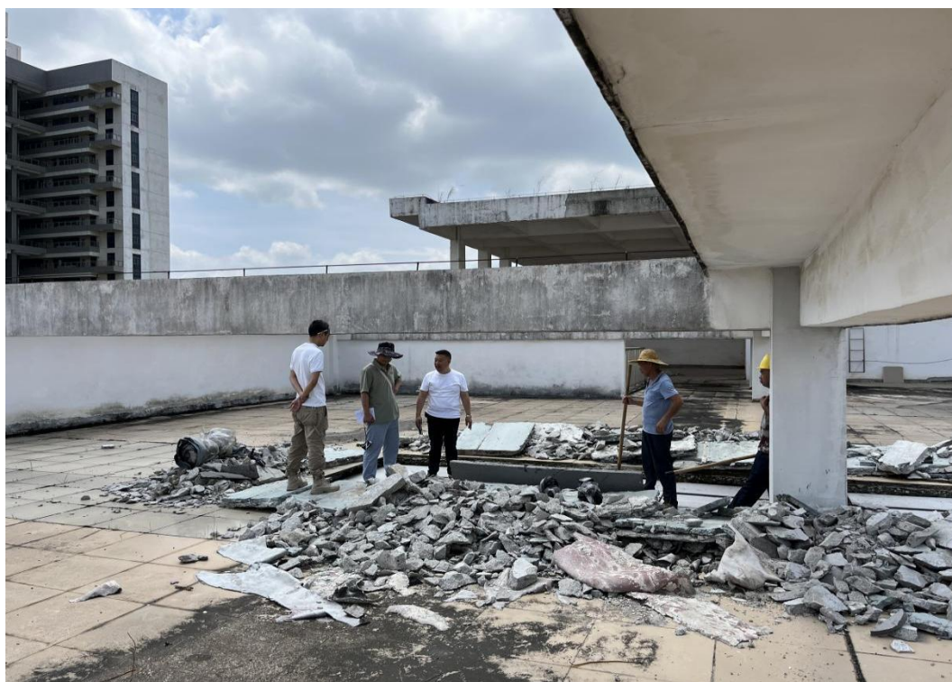
验收第二实训楼屋面修补