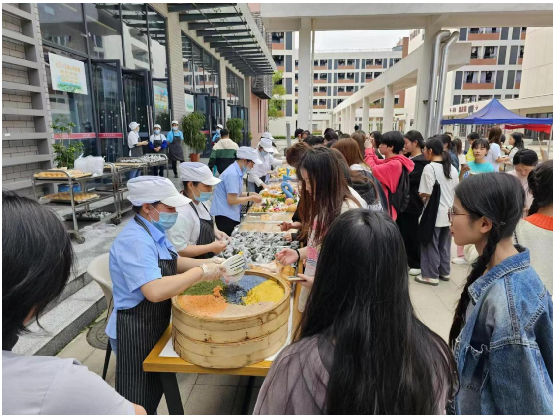
北校区食堂开展三月三品尝民族特色美食活动