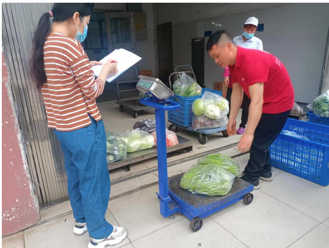
卫生所参与食堂食材验收工作