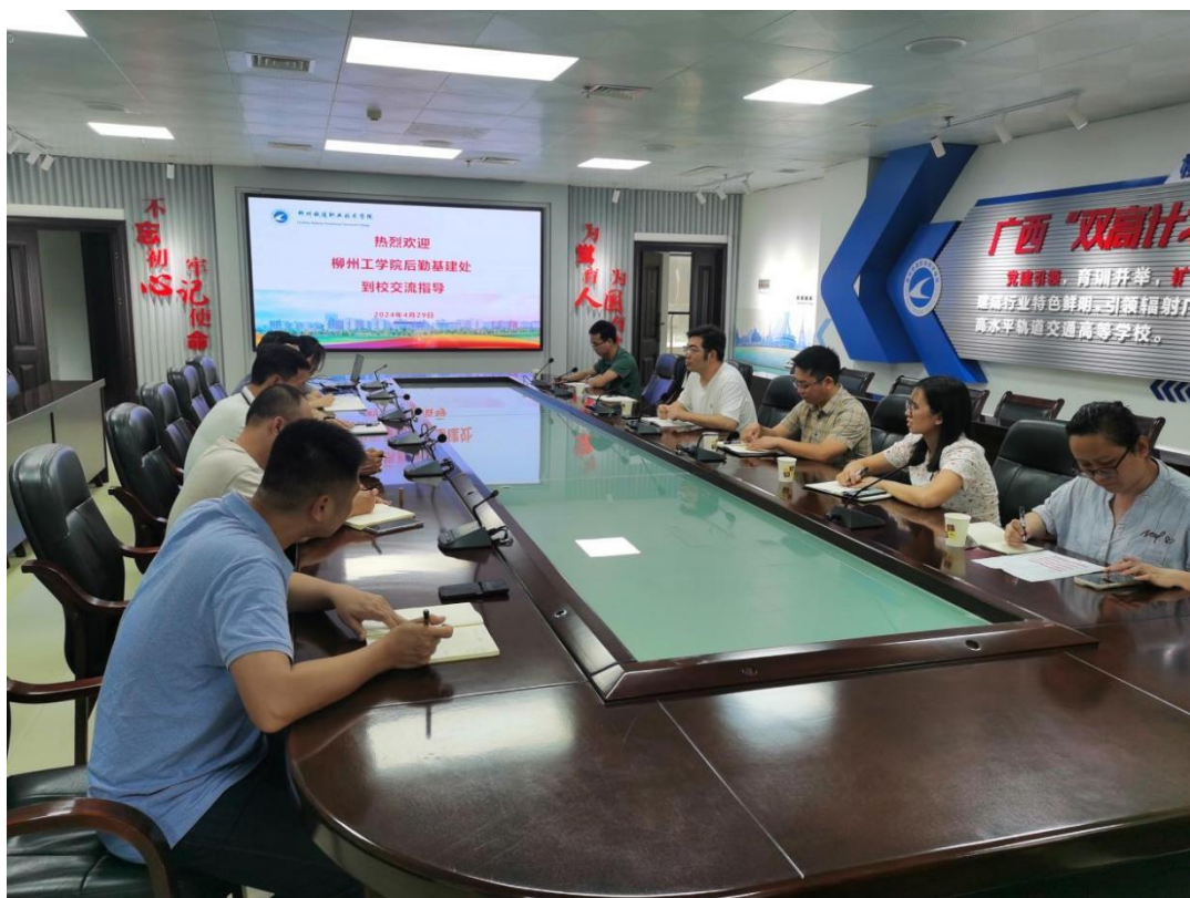
柳州铁道职业技术学院调研交流学习现场