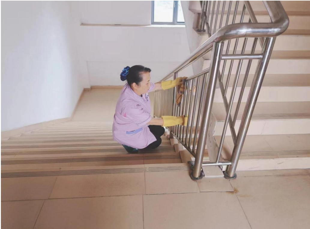
南校区朋宇组物业保洁员清洁擦拭不锈钢扶手积灰