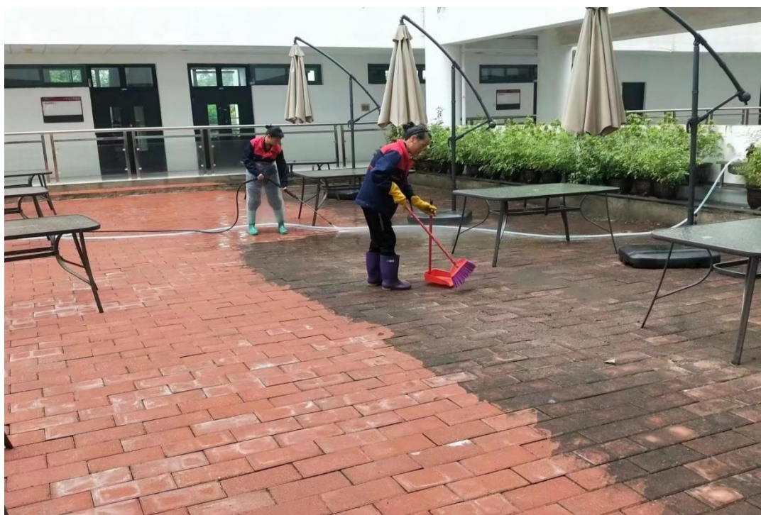
清洗第一教学楼露天休闲区域