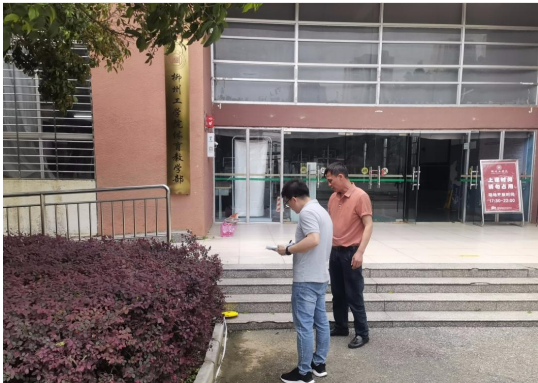
南校区风雨操场局部地面下沉修复项目工程量现场复核