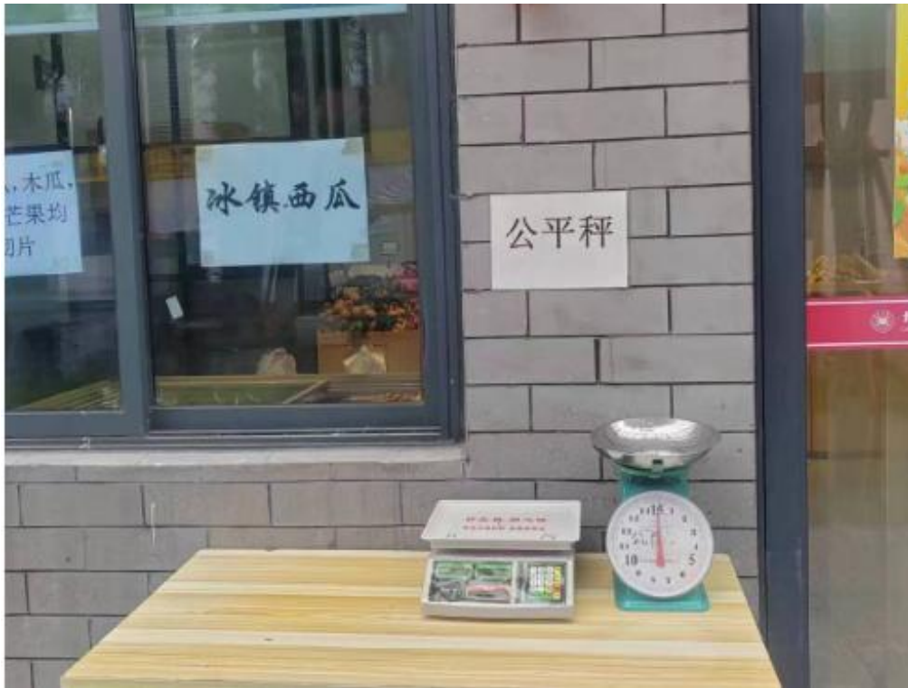
北校区水果店在店外设置公平秤