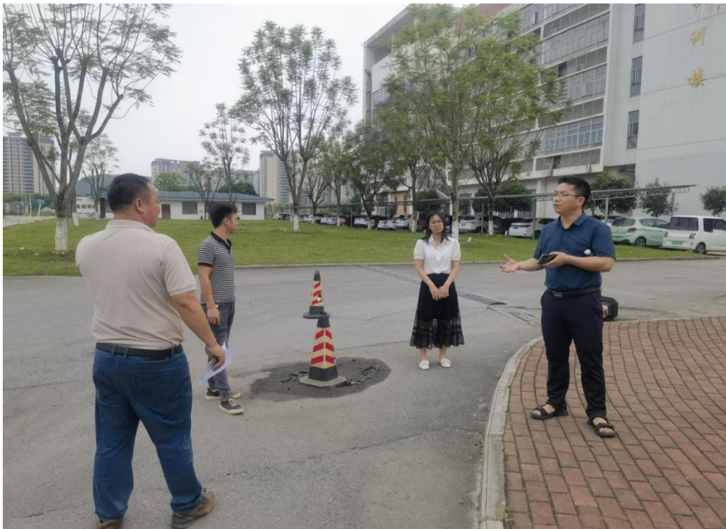
南校区部分路面修复工程（第一实训楼北侧路面）