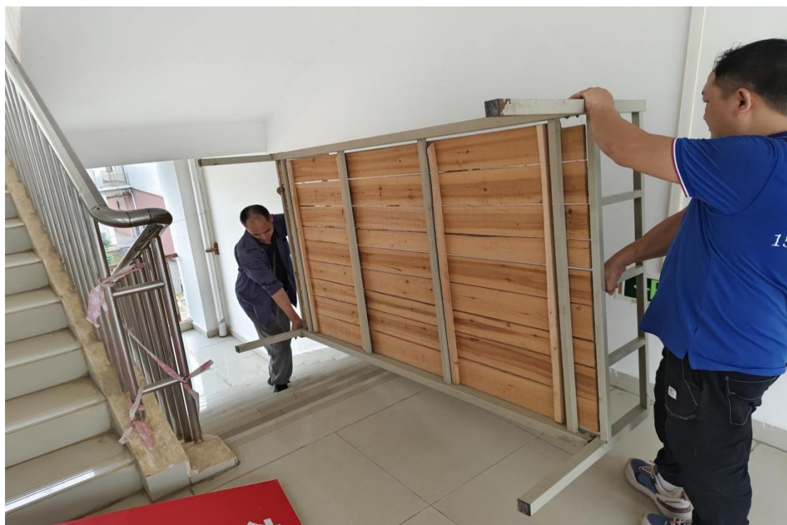
对第八栋公寓家具床进行搬运