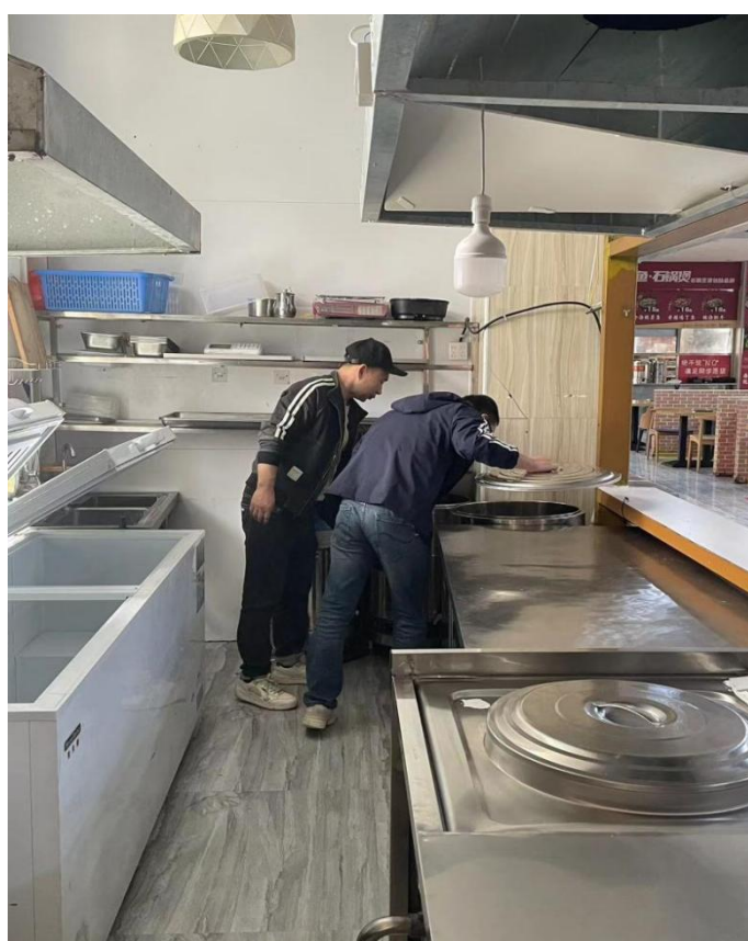
例行检查一食堂三楼食品卫生情况