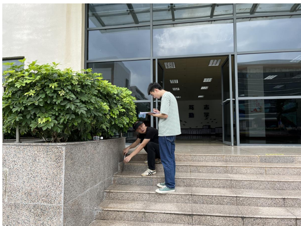
验收科教楼地砖修补