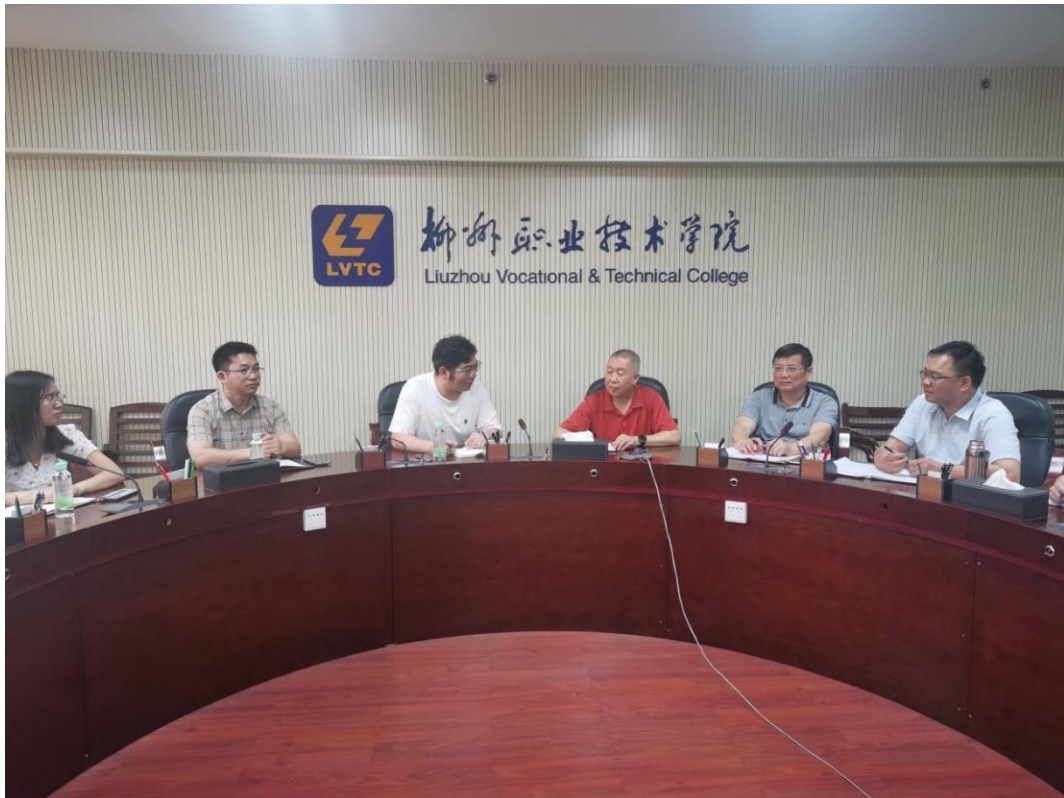
柳州职业技术学院调研交流学习现场