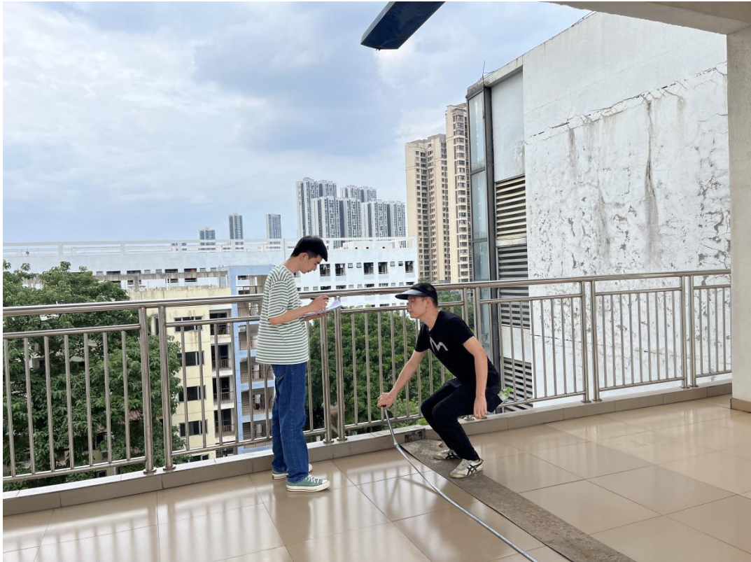
验收第一实训楼五楼地砖修补