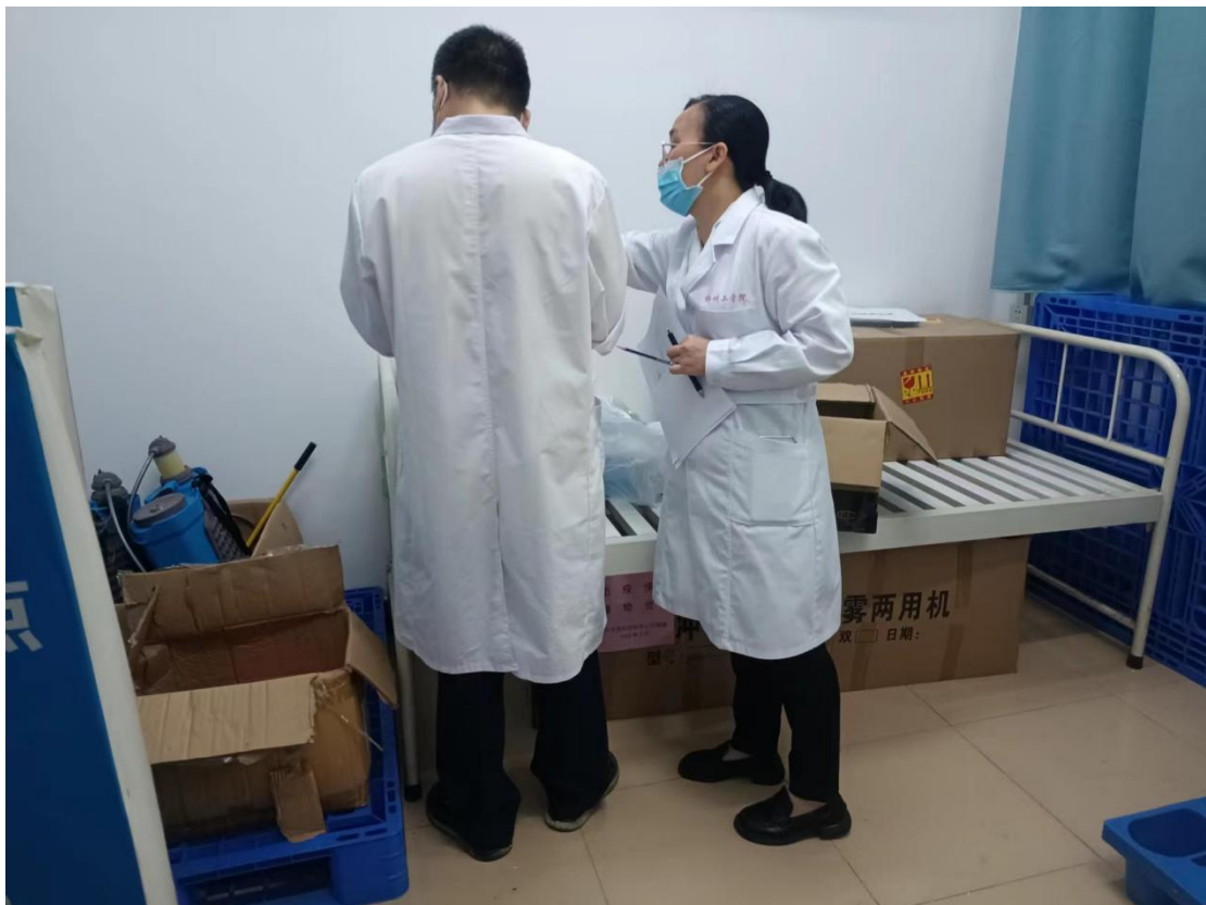
防疫物资盘点工作