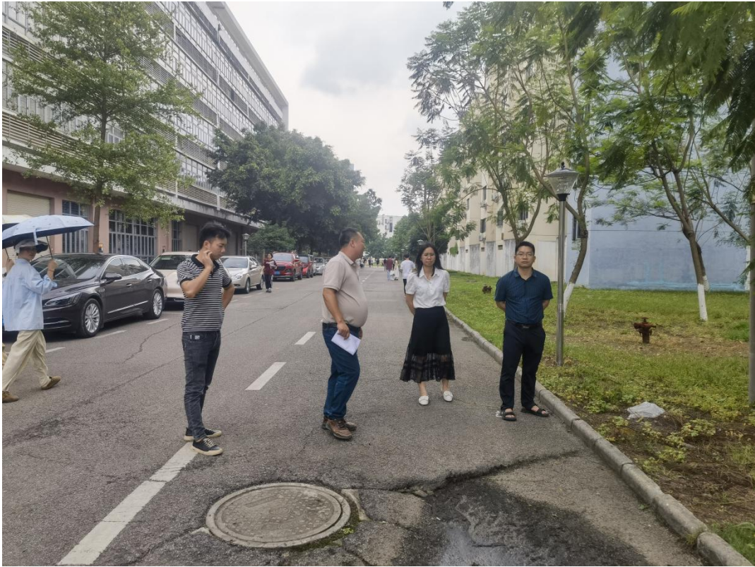
南校区部分路面修复工程（第7栋宿舍楼路面）