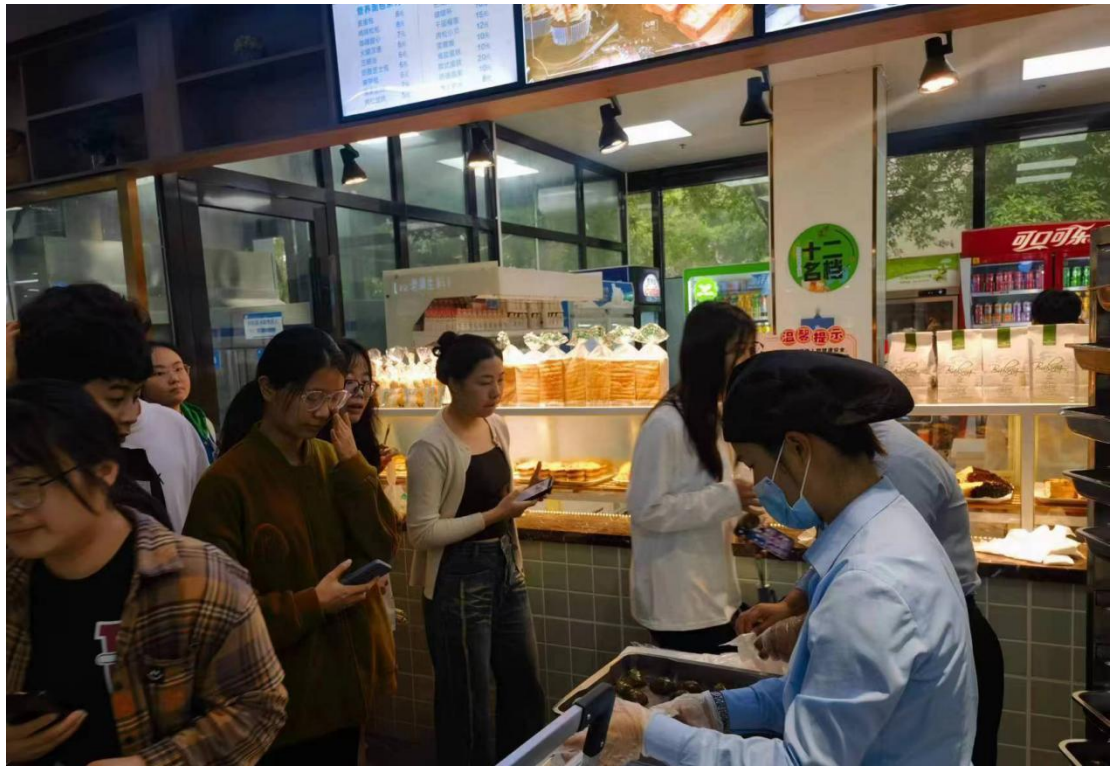
二食堂开展“三月三”发放青团、五色糯米饭活动