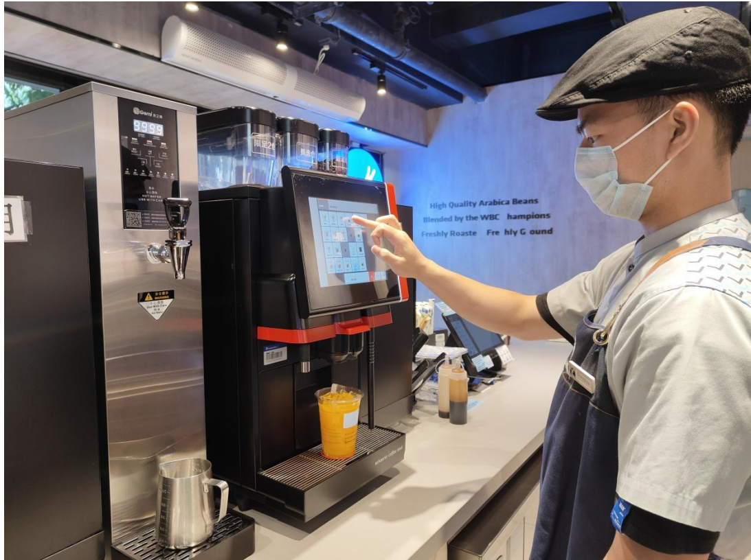
我校瑞幸咖啡门店于4月推出一系列优惠活动