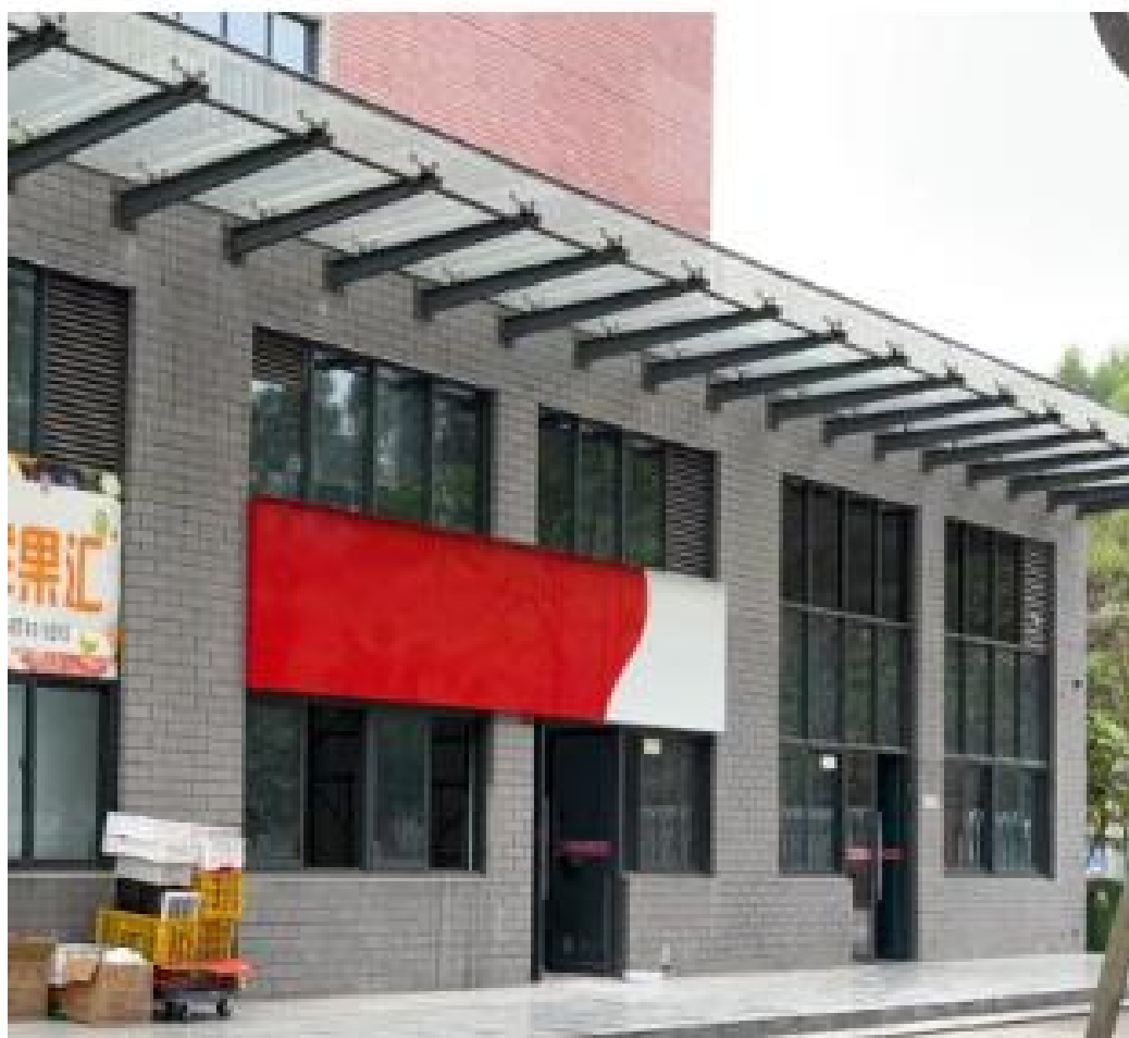
我校北校区食堂商业1-4号门面于4月份装修