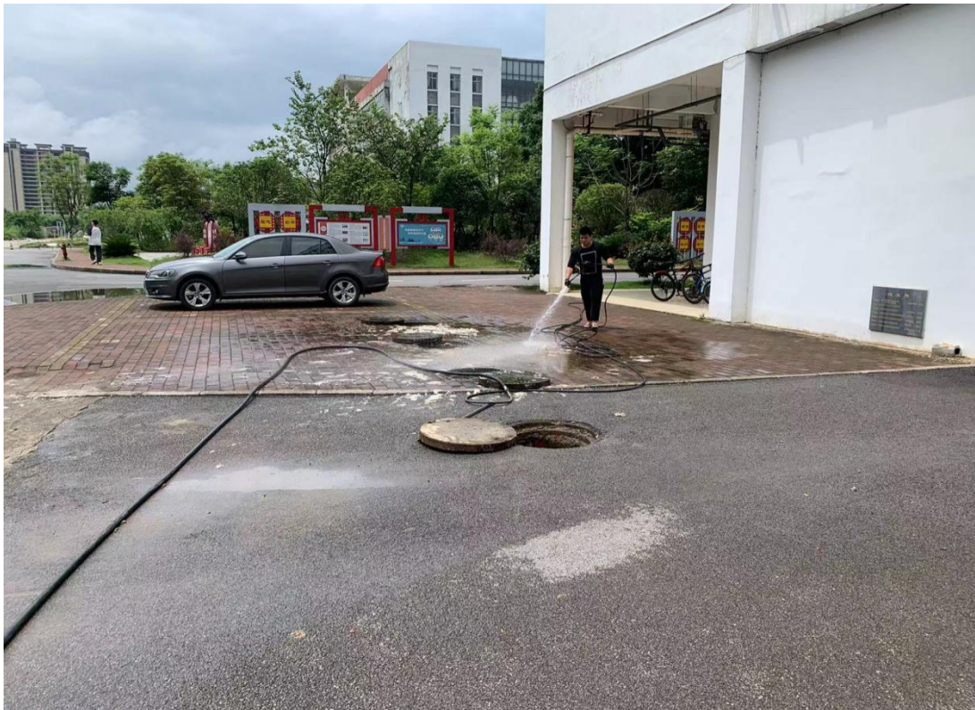
南校区及时处理第10栋化粪池堵塞、溢满情况