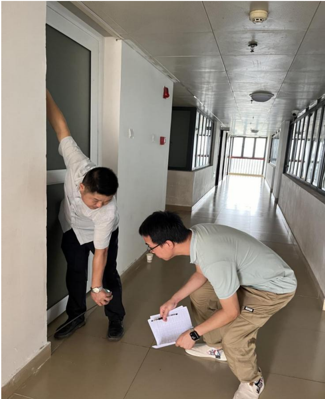
验收科教楼第18楼茶水间改造